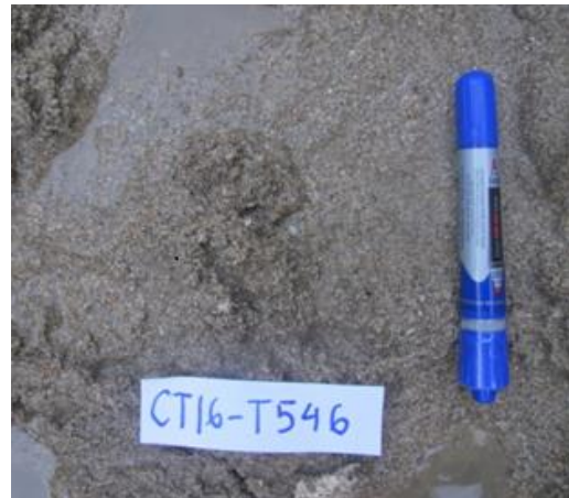
Ảnh 2. Trầm tích cát màu xám, xám phớt vàng