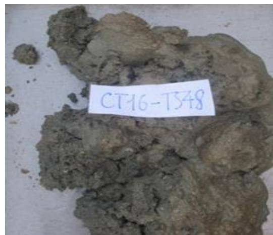
Ảnh 4. Trầm tích cát bùn màu xám-xám xanh