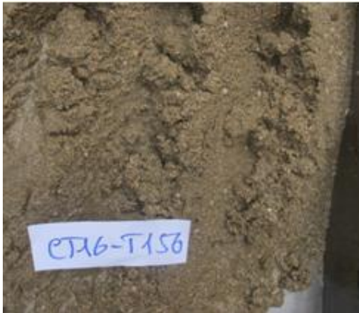
Ảnh 1. Trầm tích cát sạn màu xám-xám sáng chứa nhiều vụn vỏ sinh vật

trầm tích, Hình 2 cho thấy các trầm tích hạt thô bám quanh đảo với các hợp phần cát, sạn chủ yếu là thành phần thạch anh, mảnh đá. Tuy nhiên các trầm tích hạt thô này phụ thuộc khá nhiều vào đặc điểm địa hình địa mạo đáy biển cũng như ven bờ biển. Điều này được thấy rõ ở 2 khu vực sau: Khu vực phía Đông - Đông Nam vùng nghiên cứu, địa hình - địa mạo đáy biển tương đối đơn giản, bề mặt đáy biển phân đới từ 0÷35 m nước, địa hình khá dốc ở độ sâu từ bờ ra tới 20 m nước đặc trưng là các trầm tích hạt thô cát, cát sạn và cát lẫn sạn, từ 20÷35 m địa hình tương đối thoải dần chủ yếu tích tụ các trầm tích hạt mịn hơn (cát bùn sạn, cát bùn lẫn sạn, cát bùn và cát bột). Các trường trầm tích này có đặc trưng bởi độ chọn lọc tốt đến rất kém ( So = 1,135÷7,424), chứng tỏ ở đây các trầm tích chịu sự tác động mạnh của dòng chảy.