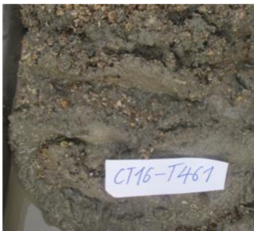
Ảnh 3. Trầm tích cát bùn sạn màu xám, xám phớt vàng